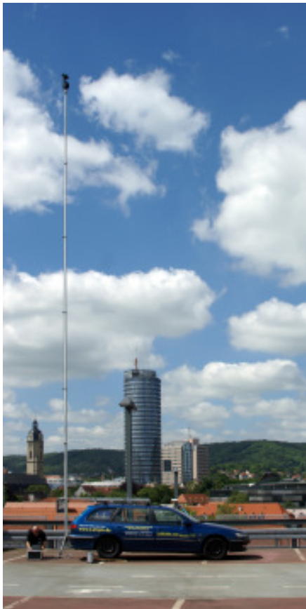
BEI DER ARBEIT ZU EINEM 360° -PANORAMA IST DAS STATIV HIER AUF CA. 13M AUSGEFAHREN

FÜR AUFNAHMEN BEI SCHWIERIGEM GELÄNDE ODER IN HALLEN UND GESCHLOSSENEN RÄUMEN KANN ICH DAS HOCHSTATIV VOM AUTO NEHMEN UND AUF EINEM STATIVFUSS STEHEND AUSFAHREN. DADURCH SIND ALLE STANDORTE ZU ERREICHEN, DIESES SYSTEM IST ALSO ÄUSSERST MOBIL UND FLEXIBEL.