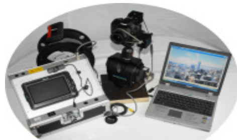
EQUIPMENT: STEUERGERÄT MIT MONITOR, FOTOKOPF MIT KAMERA (AUFLÖSUNG 15 MIO PIXEL)